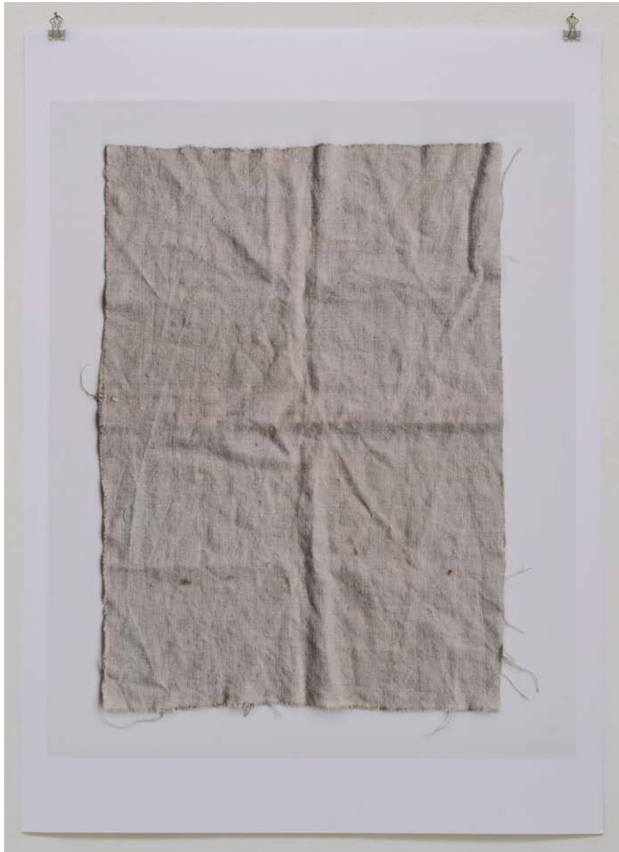
Leinwand 04 | 2015 | Digitaler Pigmentdruck auf Papier | 91 cm x 66 cm | 3 + 2 EA